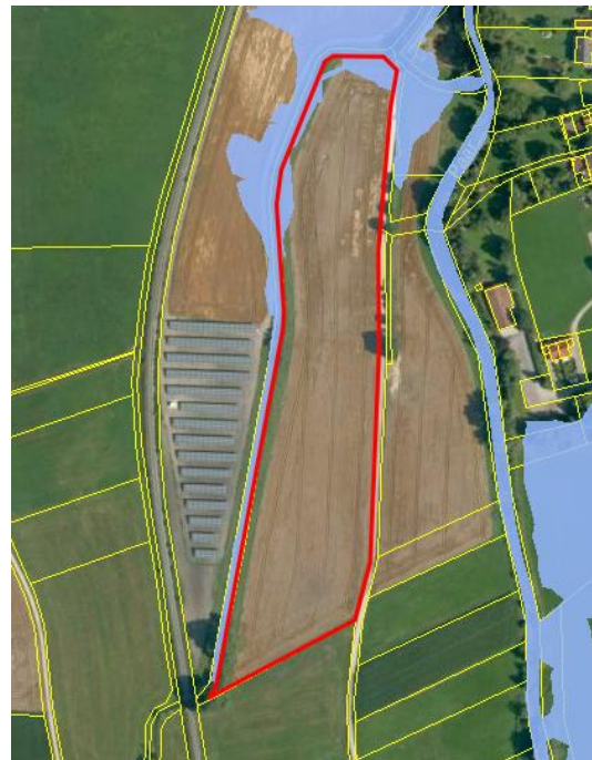
Abbildung 4: Hochwassergefahrenfläche HQ100 im Bereich des Planungsgebietes (Bayerisches Landesamt für Umwelt); rot: Planungsgebiet

Die Planung führt zu einem geringen Eingriff in das Schutzgut.