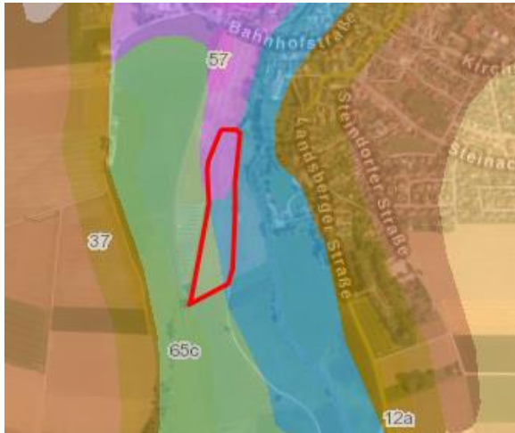
Abbildung 3: Auszug aus der Übersichtsbodenkarte von Bayern (Bayerisches Landesamt für Umwelt); rot: Planungsgebiet

Der Boden im nördlichen Drittel des Planungsgebietes ist fast ausschließlich Gley-Rendzina und Rendzina-Gley aus Schluff (62a, rosa). Im mittleren Drittel befindet sich fast ausschließlich kalkhaltiger Gley aus Schluff bis Lehm über Carbonatsandkies (62b, blau). Im südlichen Drittel der Fläche ist fast ausschließlich kalkhaltiger Anmoorgley aus Schluff bis Lehm über tiefem Carbonatsandkies vorhanden (62c, grün) (vgl. Abbildung 3).