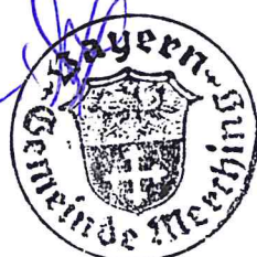
Helmut Luichtl 1. Bürgermeister