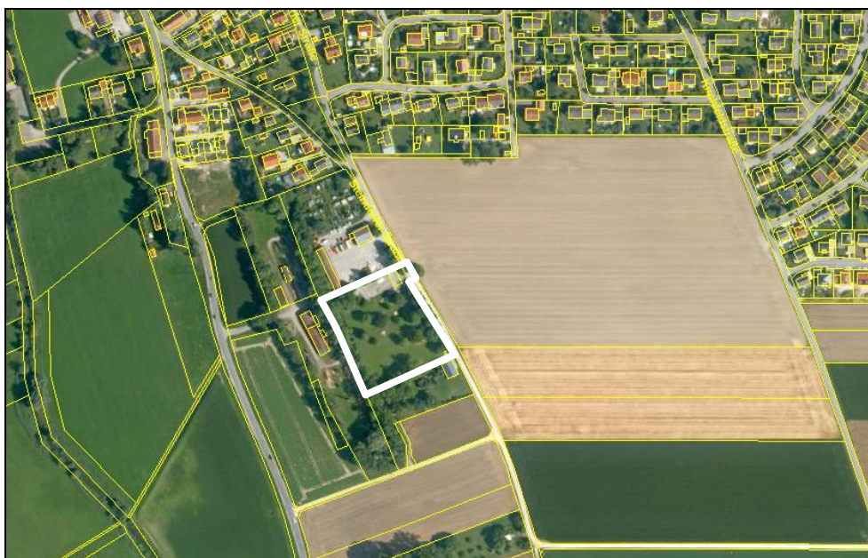
Luftbild Lage Plangebiet

Das Plangebiet des Bebauungsplanes Nr. 36 „Freizeitanlage am Bauhof“ befindet sich im Süden der Ortslage Merching, südlich des gemeindlichen Bauhofes und westlich der Steindorfer Straße. Es umfasst eine bereits als Spiel- bzw. Bolzplatz, Dirt-Bike-Bahn und Skateranlage genutzte Teilfläche des Grundstücks Flur Nr. 998 sowie eine Teilfläche des Grundstücks Flur Nr. 988 (Steindorfer Straße), jeweils Gemarkung Merching.